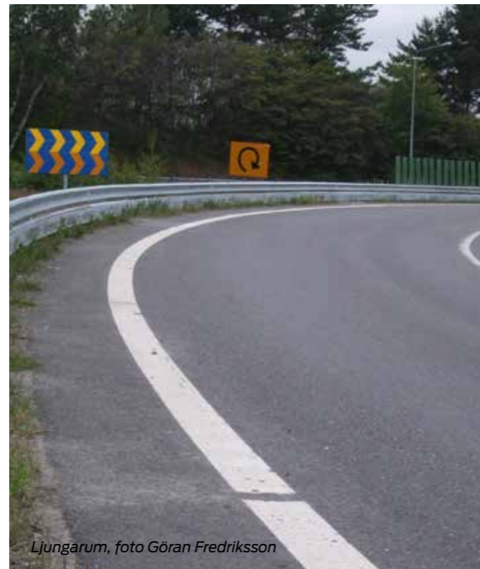
Ljungarum, foto Göran Fredriksson

*Cirka trettio motorcyklister omkommer i trafiken varje år. Antalet omkomna på motorcykel har dock minskat sedan 2006, men antalet omkomna varierar stort från år till år. Under 2021 omkom 25 motorcyklister. Av de som förolyckas är det cirka fyra motorcyklister per år som omkommer i kollision med räcken.