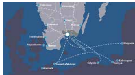
Karlshamn - ett bra investeringsläge