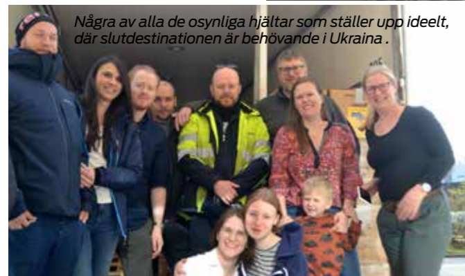
Några av alla de osynliga hjältar som ställer upp ideellt, där slutdestinationen är behövande i Ukraina.