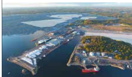
Stilleryd & Karlshamns Hamn