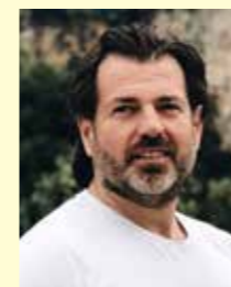
Ansvarig utgivare Dennis Johansson

Besiktningintervallen är tolv månader för lastbilar över 3,5 ton, samma gäller även för tunga släp; den förlängdes till följd av en tillfällig EU-förordning på grund av Corona under 2020-2021. Det kan ha en liten inverkan då intervallen för besiktningen blev längre, upp till sju månader. Men man kan ändå inte blunda för att efterkontrollerna bara ökade med en procent under perioden, viket visar att siffran var mycket hög redan innan pandemin. Det transportslag som behöver komma tillbaka för ombesiktning färre gånger än alla andra är MC. Här behöver bara tio procent åka tillbaka till besiktningsstationen med mössan i handen för att få sin motorcykel godkänd. Läs mer om detta på sidan 24.