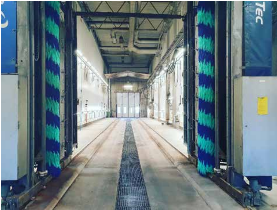
Längden på en handbollsplan är 40 meter. LP som fyller 40 i år har två tvätthallar som är längre än så: 42 meter vardera.

Ja, faktum är att det verkligen finns de som kommer långväga för att få sina fordon tvättade i Örebro (till såväl anläggningen på Truckstop-Berglunda och till anläggningen vid Pilängens Industriområde).