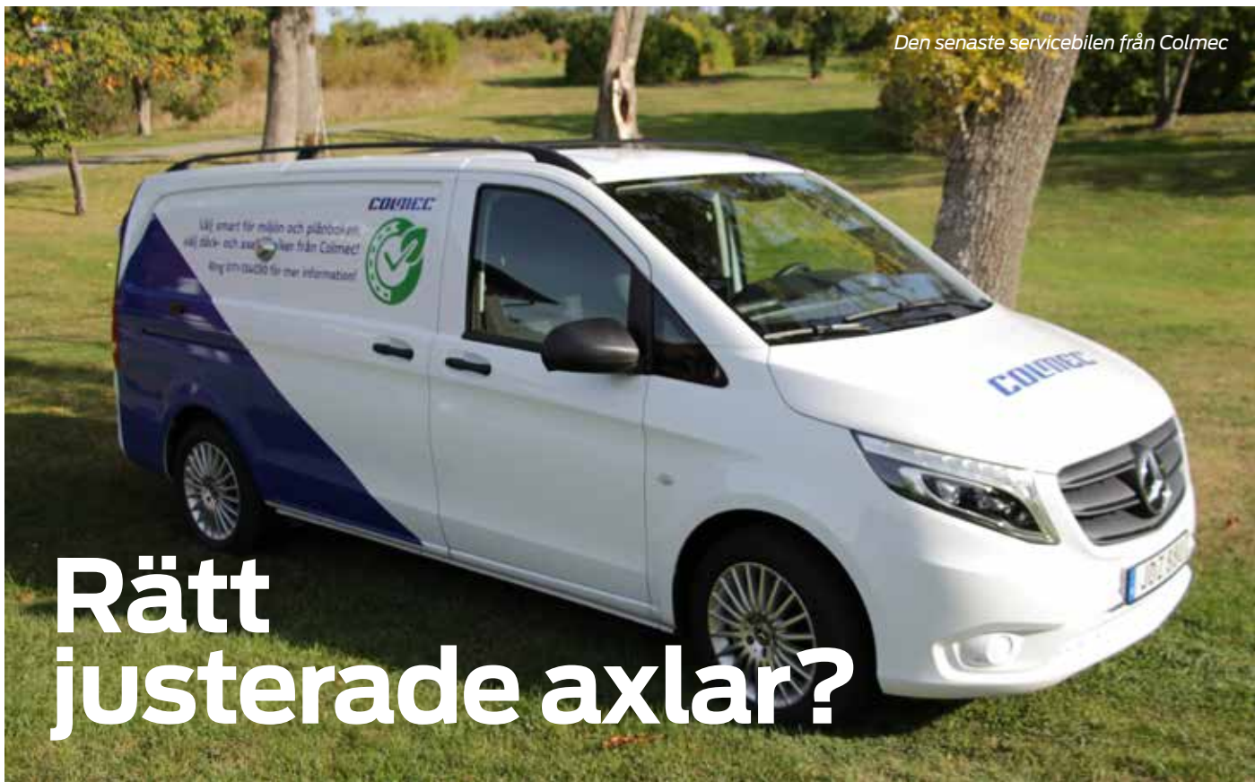
Den senaste servicebilen från Colmec