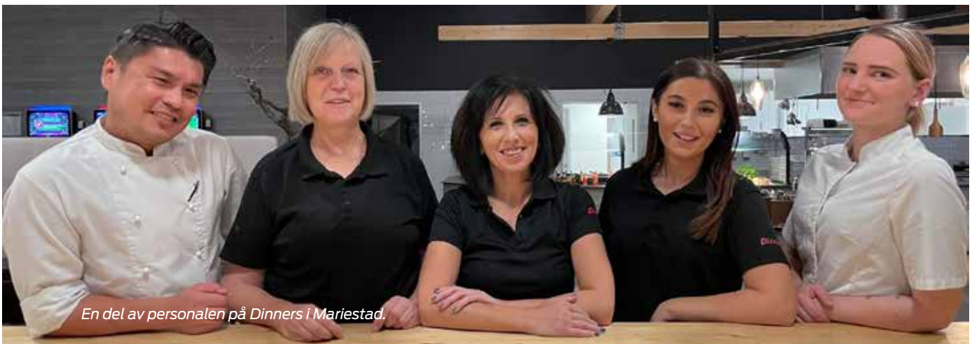
En del av personalen på Dinners i Mariestad.