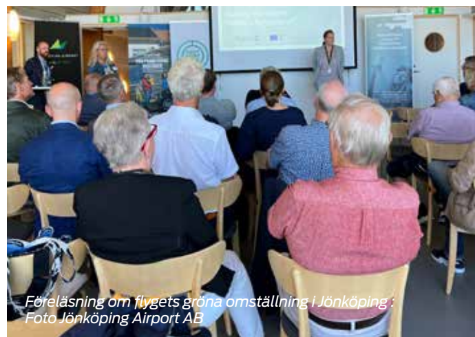
Föreläsning om flygets gröna omställning i Jönköping

Under hösten har Grön Flygplats besökt fem flygplatser, med sig har man haft ett elflygplan. Under turnén sker föreläsningar om flygets gröna omställning för politiker, näringsliv, branschfolk och press. Åhörarna får även ta del av en presentation och demonstration av det tvåtsitsiga elflygplanet som följer med under hela turnén. Grön Flygplats finansieras av Tillväxtverket via EU. /DJ