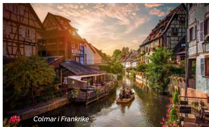
Colmar i Frankrike

Och nu till något mer kulinariskt: Vad sägs om 85 kilometer av tyska vingårdar? Vinvägen tar dig genom regionen Pfalz i södra Tyskland. Här njuter du till fullo av Rieslingviner och idylliska miljöer.