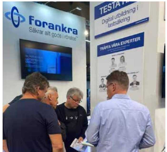
En nyhet på lastbilmässan var att Forankra nu kan erbjuda lastsäkringsutbildningar digitalt

Utbildningen är uppdelad i 10 kursavsnitt som tar avstamp i grunderna och därefter behandlar sådant som till exempel lastsäkringsmetoder, lastbärare, ansvaret för godset,