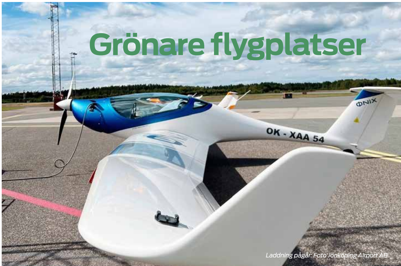
Laddning pågår.

Flyget står inför stora miljöutmaningar, inte bara i luften. Grön Flygplats har arbetat med gröna frågor inom det svenska flyget sedan juli 2019.