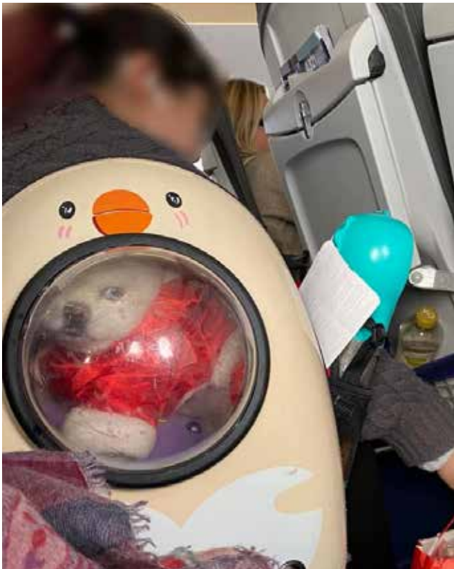
Så här ska det inte se ut.

Många vet inte vad som gäller när de vill ta med en hund på flyget. Att vissa flygbolag inte heller inte vet detta är under all kritik.