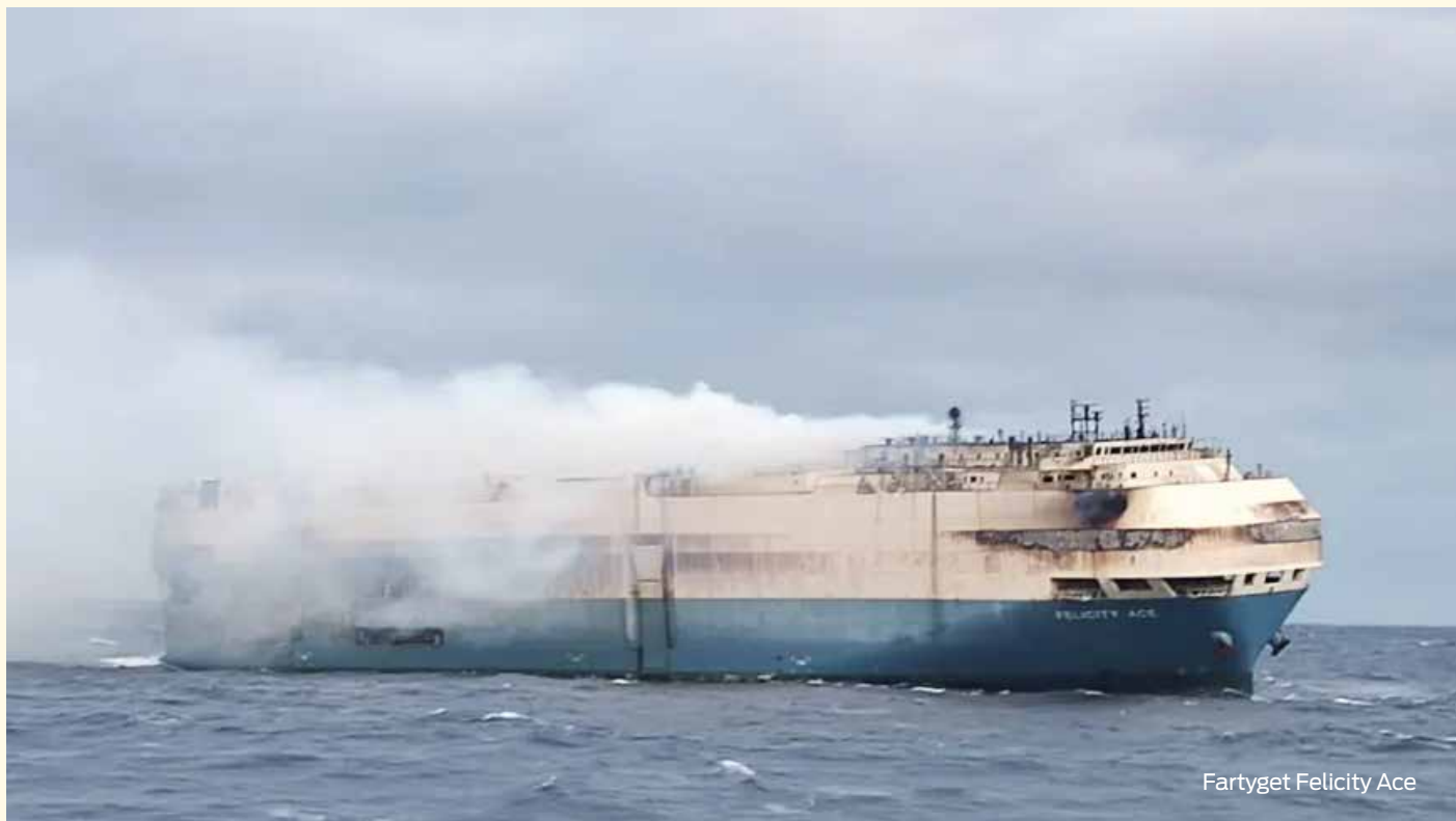
Fartyget Felicity Ace

El-bilar brinner titt som tätt runt om i Europa, där vissa brandkårer har utrustats med så kallade "Sand-Containers", där man lyfter in den brinnande elbilen som får brinna ut – då de inte har något annat sätt att släcka dessa bränder.