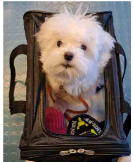
Så här ska det se ut.

Vi har här valt att ta upp ett exempel (med bildbevis). På sträckan Frankfurt-Köpenhamn den 27 januari i år hade en passagerare sin